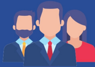
นิติบุคคล