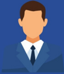
บุคคลธรรมดา กิจการเจ้าของคนเดียว